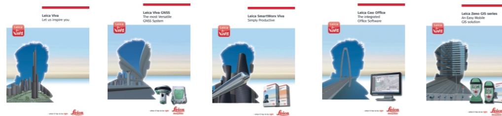
Leica Viva Обзорная брошюра

Иллюстрации, описания, технические характеристики не прилагаются. Printed in Switzerland - Copyright Leica Geosystems AG, Heerbrugg, Switzerland, 2010. 781664en - IX.10 - RDV